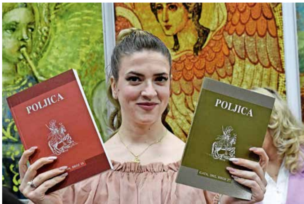
Posebna regija, poput Poljica, zaslužuje i poseban status