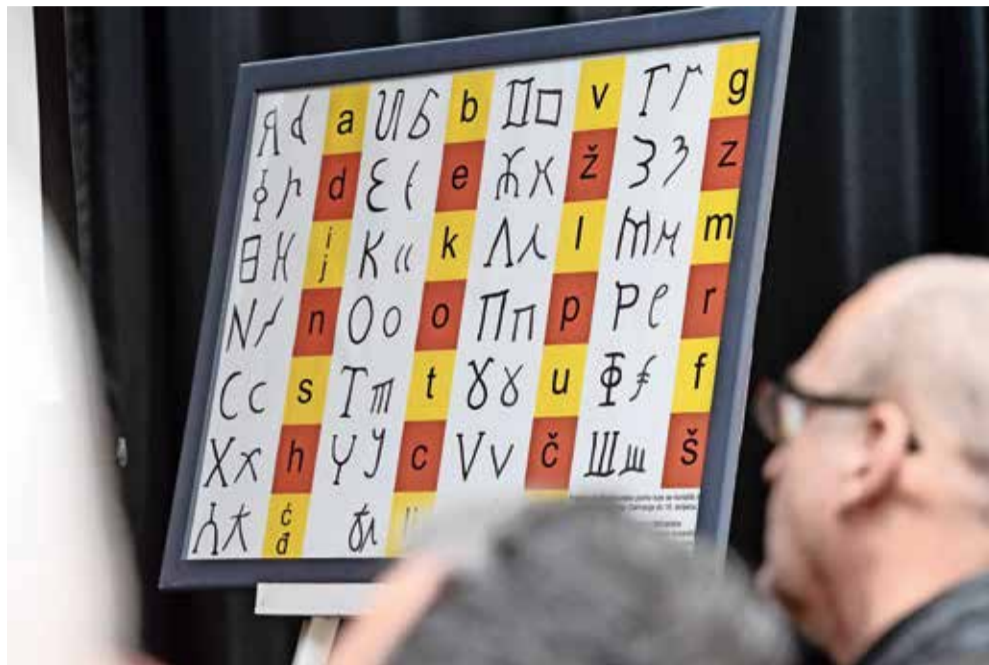
Poljičica se još naziva i poljičkom bosančicom, azbukicom i arvaticom